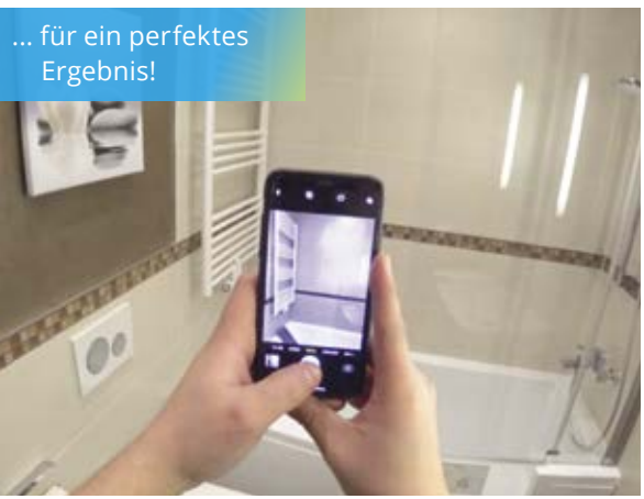
... für ein perfektes Ergebnis!