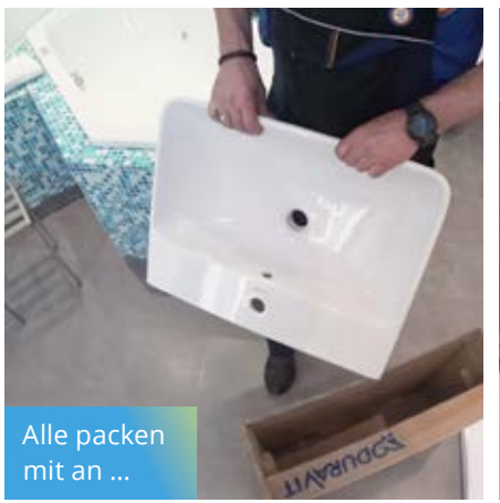
Alle packen mit an ...