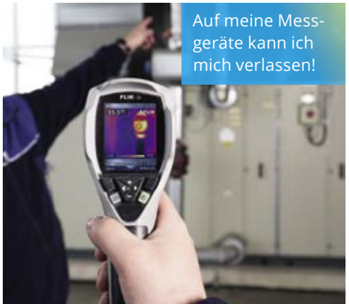
Auf meine Messgeräte kann ich mich verlassen!