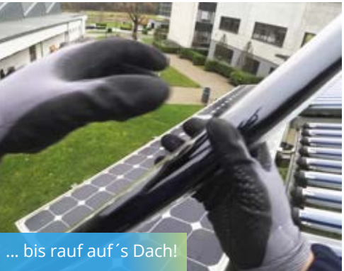
... bis rauf auf 's Dach!