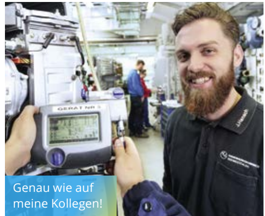
Genau wie auf meine Kollegen!