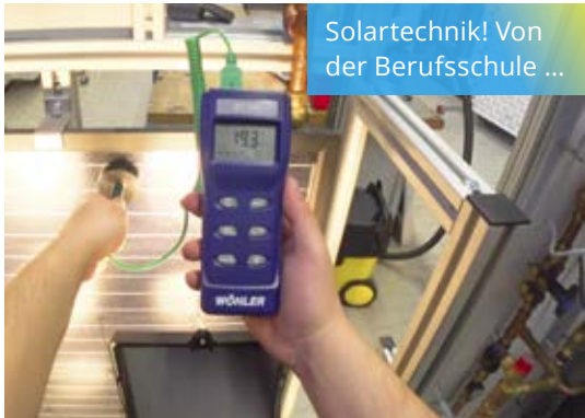
Solartechnik! Von der Berufsschule ...